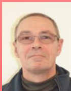
CE : P. Ferey