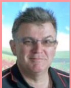
DP: D. Chappuis